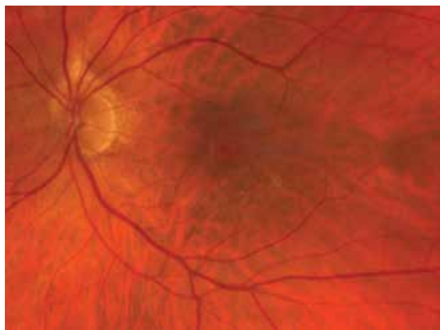
Obrázek 1. Fotografie makulární díry (Zeiss Clarus 700)

Cílem naší práce je porovnání funkčních a anatomických výsledků mezi technikou invertovaného laloku ILM a konvenčním odstraněním ILM u idiopatických makulárních děr na našem pracovišti.