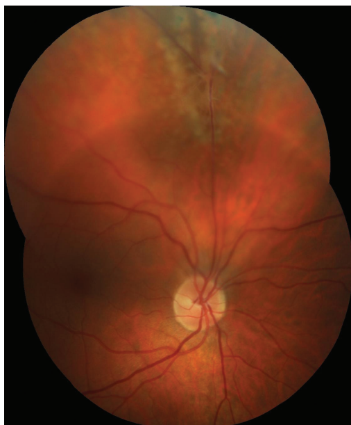
Obr. 4 Barevný fotografický snímek fundu pravého oka: proximální úsek perzistující arteria hyaloidea upínající se k horní temporální arkádě s lokálním trakčním odchlípením sítnice staršího data