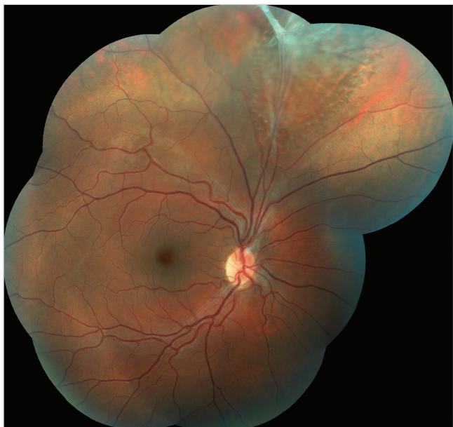
Obr. 1 Barevný fotografický snímek fundu pravého oka: sítnice je v horních kvadrantech prořídlá, při horní temporální arkádě jsou pozůstatky perzistující arteria hyaloidea s fibrotickou tkání způsobující lokální retinoschízu staršího data

viště ke zvážení dalšího postupu. Obě pacientky si dlouhodobě stěžovaly na postupně se zhoršující vidění a pocity tlaku v očích. Vyšetření očního pozadí v mydriáze odhalilo preretinální fibrózu způsobující v jednom případě lokální trakční odchlípení sítnice (TOS) a ve druhém případě lokální retinoschízu.