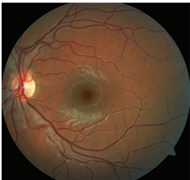
Obr. 2 Barevný fotografický snímek fundu levého oka: na očním pozadí fyziologický nálezn

První kazuistika: 15letá dívka byla na naše pracoviště odeslána spádovým očním lékařem ke zhodnocení očního nálezu po útoku chovankyněmi Dětského domova, kde byla opakovaně kopnuta do hlavy, především do oblasti pravého