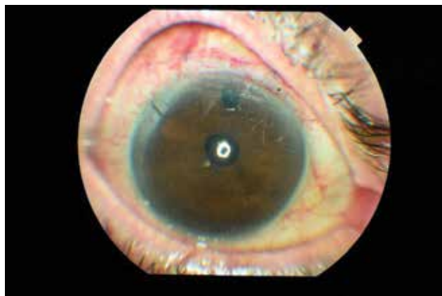
Obrázek 1c. Obrázek předního segmentu v 1. týdnu ukazující téměř úplné vymizení triamcinolonu acetonidu (TA) z přední komory