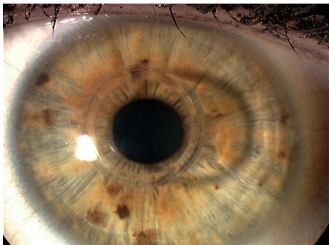
Obr. 1 Rohovka s implantovaným MyoRingem

GmbH, Austria) je alternativní technikou, kterou pro použití v korekci keratokonu popsal Daxer (6), (obr. 1). Kroužek je vyroben z polymethylmetakrylátu a je částečně flexibilní. Je dostupný v průměrech 5 a 6 mm, tloušťka prstence je 240, 280 a 320 \mu\text{m} . Typ kroužku je volen dle požadovaného efektu dle nomogramu doporučeného výrobcem (tab. 1). Kroužek je implantován do rohovkové kapsy průměru cca 9 mm, v hloubce 300 \mu\text{m} . Vstupní kanál do kapsy je umístěn zpravidla temporálně a jeho šířka je přibližně 4–5 mm, délka cca 2 mm. Intrastromální kapsu lze vytvořit pomocí speciálního mikrokeratomu, kdy řez je vytvořen vibrujícím diamantovým nožem po předchozím přisátí hlavy keratomu na rohovku pacienta (PocketMaker, DiopTex GmbH, Austria). Jinou možností je použití femtosekundového laseru (1, 9). Hlavní výhodou Myoringu ve srovnání s rohovkovými segmenty je možnost pooperační úpravy polohy prstence a tím optimalizace efektu prstence (4, 10), jednoduchá manipulace a možnost kombinace s intrastromální aplikací riboflavinu při výkonu kombinovaném s CXL (5). Roční a dvouleté výsledky u skupiny pacientů s keratokonem a implantovaným MyoRingem jsou obsahem této práce.