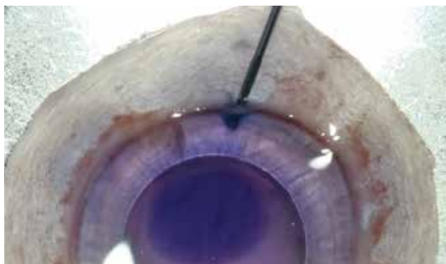
Obrázek 2. Jehla je zavedena do otvoru pod DM tak, aby se oddělila DM od rohovkového stroma a Dua vrstvy