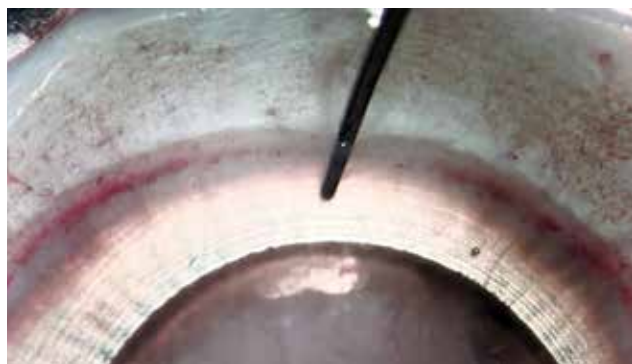
Obrázek 1. Otvor vytvořený pod DM před oddělením pomocí kapalinové bubliny

Zadní lamelární keratoplastika Descemetové membrány s endotelem (DMEK), kdy je transplantována pouze tenká Descemetová membrána (DM) s vrstvou endotelu se stává stále více populární pro chirurgické řešení Fuchsovy dystrofie a bulózní keratopatie [8] a je u těchto indikací považována za metodu volby. Separace DMEK štěpu je obvykle provedena opatrným seškrábnutím a sloupnutím DM z dárcovské rohovky [1,6]. Tento proces je časově náročný, vyžaduje vysokou zručnost a přináší nemalé riziko protržení membrány [2,8,15]. Nedávno se objevily nové metody, u kterých dochází k oddělení DM pomocí vzduchu/tekutiny injikované mezi DM a rohovkové stroma [9,13,14,16]. Přímé kapalinové oddělení pomocí jehly zasunuté mezi DM a rohovkové stroma je rychlý a jednoduchý způsob, který minimalizuje riziko roztržení membrány [11,16]. Navíc v průběhu oddělení pomocí kapaliny